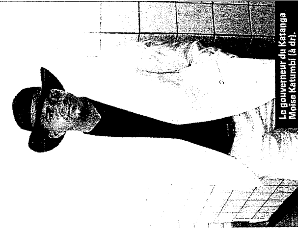
Le gouverneur du Katanga Moïse Katumbi (à dr.).

Lors de la présentation du long-métrage en avant-première au Fespaco, au début de mars, les apparitions, dans le film, du très populaire et très populiste Katumbi ont suscité de vives réactions – parfois des rires, le plus souvent des murmures approbateurs. Sans doute parce qu'il joue un rôle de protecteur, bien qu'ambigu, celui du justicier à la Zorro, qui défend sa province et ses compatriotes quand il estime qu'ils sont exploités indûment par des hommes d'affaires prédateurs, qu'ils soient congolais ou étrangers. Mais aussi parce qu'il est suivi par un réalisateur qui l'accompagne