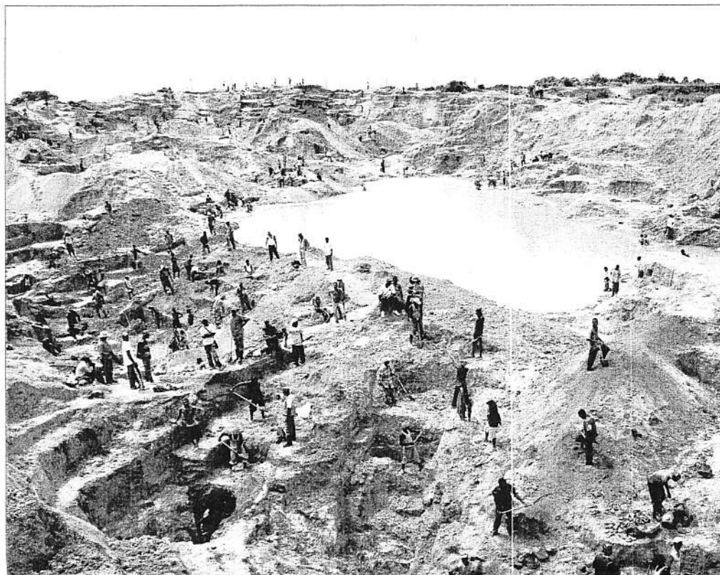
De recessie zorgt ervoor dat speculanten zich uit de kopermijnen terugtrekken. Dat biedt Katanga op termijn perspectief.

Die bedrijfsleiders komen net als vroeger nog uit het westen maar steeds vaker uit het Oosten, met India en vooral China als koplopers. Dat laatste land past bovendien een heel andere tactiek toe om zijn slag thuis te halen, een aanpak die efficiënter blijkt dan de westerse manier van werken. 'Een westerse bedrijf zal eerst een exploratiecontract afsluiten om te kijken hoeveel